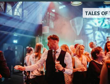
TALES OF TOMORROW