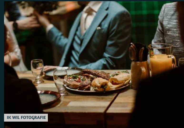
IK WIL FOTOGRAFIE