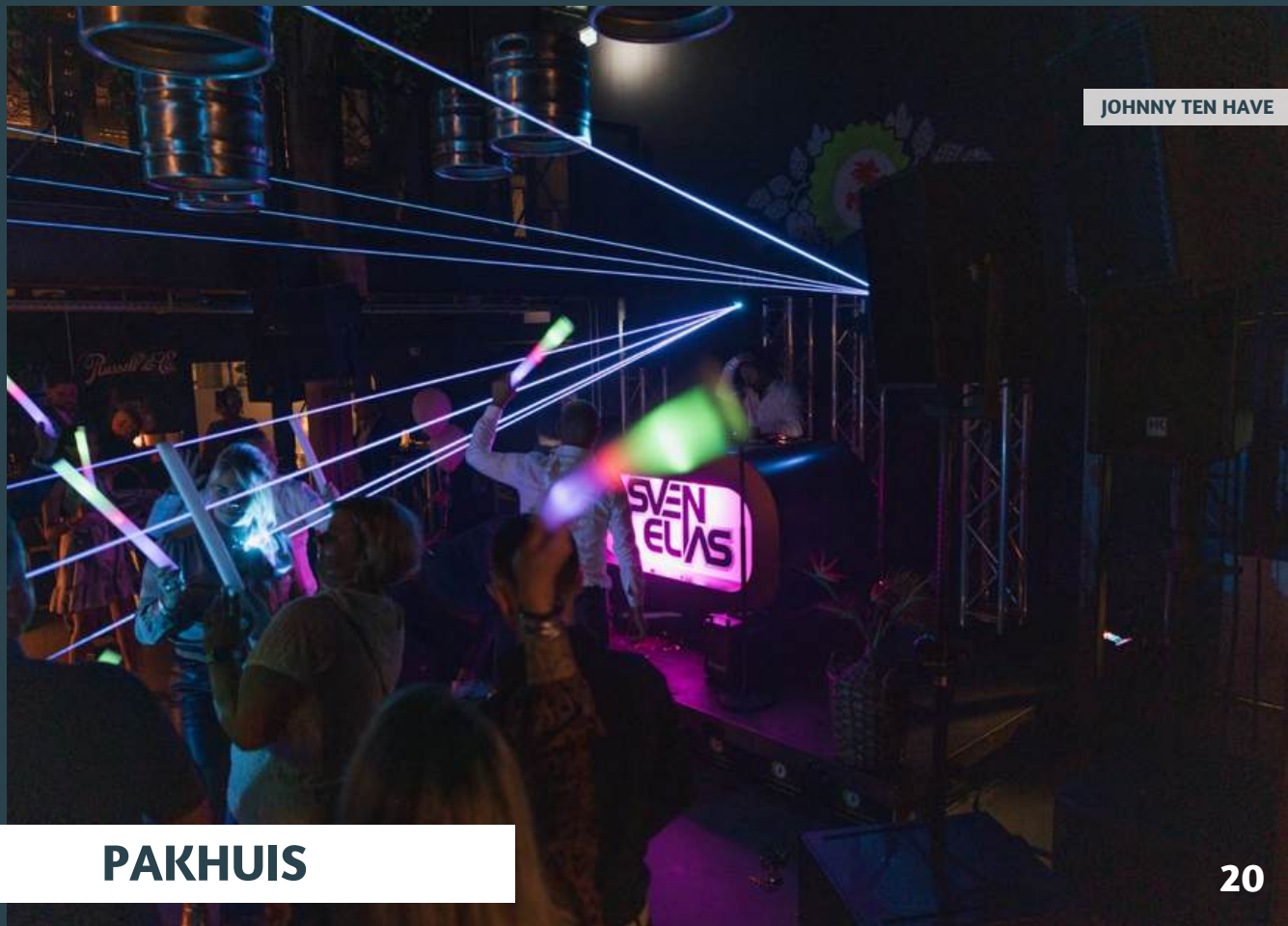
JOHNNY TEN HAVE