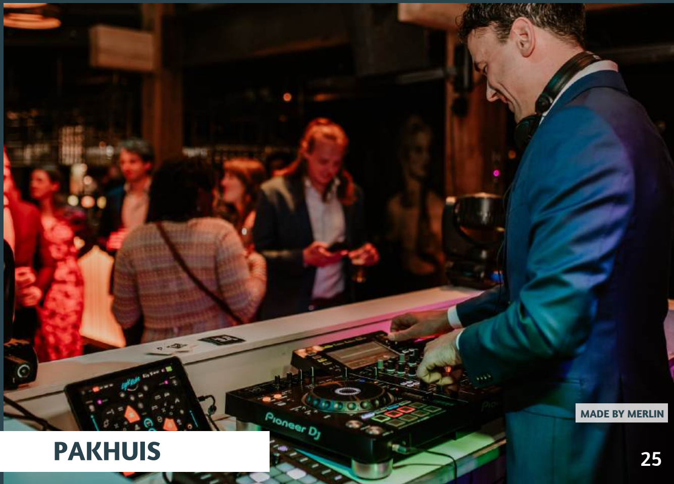
MADE BY MERLIN